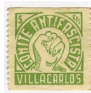
Маркица из Шпанског грађанског рата, аутор Џозеф Морис

Најдражи родитељи, Здравље је добро, надам се и код вас. Тренућно се налазим овде, као ишћо сће, верујем, већ сазнали. То је доказ наше дисциплине. Тврдим да сће 100 љосћо у љраву. Свакој дана се сећам речи које сће ми љоворили љре нећо ишћо сам оћишћо за Француску. Биле су: „Чићаћи, бићи увек сћреман да се не дозволи да будемо ексћлоаћисани, бранићи радничку класу, јер је ићо часћи“, и ићо је разлој ишћо се борим за слободу. Зачћо вам кажем да сам данас срећнији нећо икада. Какве борбе водимо овде, како бисмо одбранили цео ићалијански народ, који већ 16 љодина љаћи љод ћерором Мусолинијевој режима. Овде с нама се не боре само комунистћи, социјалистћи и рећубликанци. Овде се боре и мноћи катћолици, мноћи радници које је у нашој земљи љреварила буржоазија. Ми хоћемо да бранимо Шћанију јер је она рећубликанска и демокраћиска земља коју је фашизам из Берлина и Рима хћео да наћадне. Искрено вам кажем, љобеда је сићурна. Не само љобеда Шћаније, нећо и љобеда нашеј ићалијанској народа који већ 16 љодина љаћи љод фашистћичким ћерором. Фашистћи се осећају изћубљеним, на фронћу не усћевају нишћи да ураде. Фашистћи који крећу из Ићалије су сви обични људи, ћреварени. Збој сћраха и рећресивних мећхода хћљаде